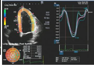
心臓(2D Wall Motion Tracking)