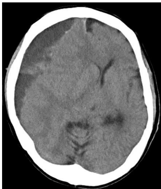
図1:慢性硬膜下血腫のCT(水平断)